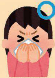
ティッシュ・ハンカチ